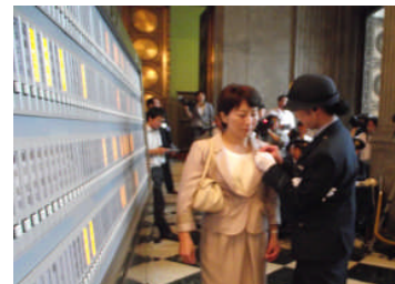
〔初登院で議員バッジを胸に〕

また、10月11日から名古屋で開催されるCOP10に向け、民主党の農林水産部門会議で新たに立ち上がった「生物多様性ワーキングチーム」のメンバーとなりました。「遺伝子組替え生物の移送」に関する日本の国家戦略的視点からの対応方針を検討して参ります。