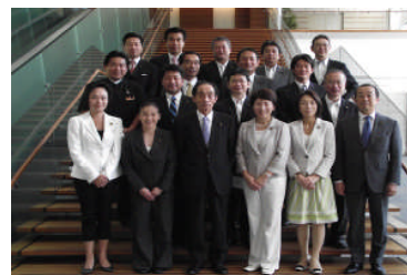
〔官邸にて初当選メンバーと〕